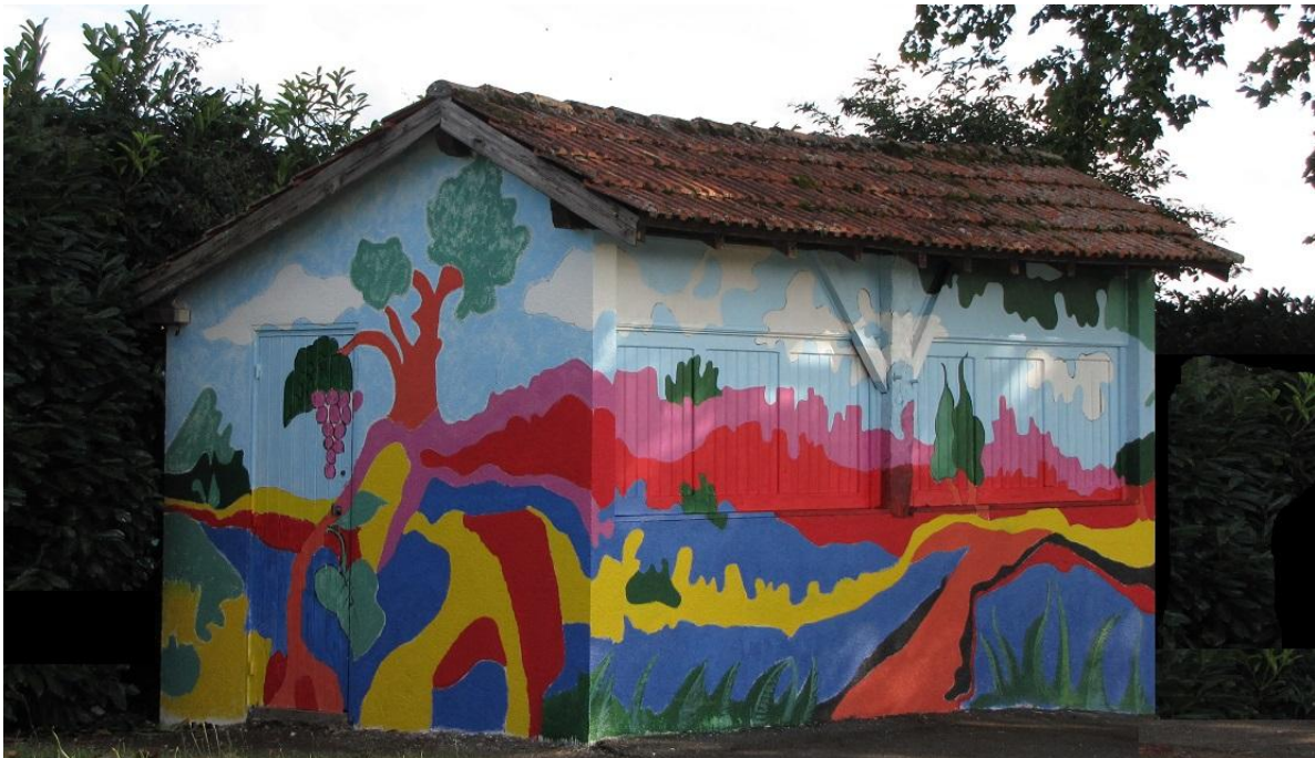
Peinture réalisée en 2014, lieu de convivialité et d'échanges